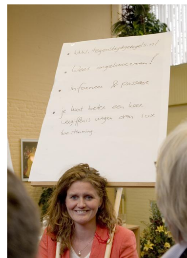
Een van de schilden met “Wees ongehoorzaam” en “www.tegenstrijdigeregels.nl”

“Stichting Het goede voorbeeld”, “Laat de regels je uitdagen en niet belemmeren”, “Cynisme laten varen en terug naar eigen kracht”,