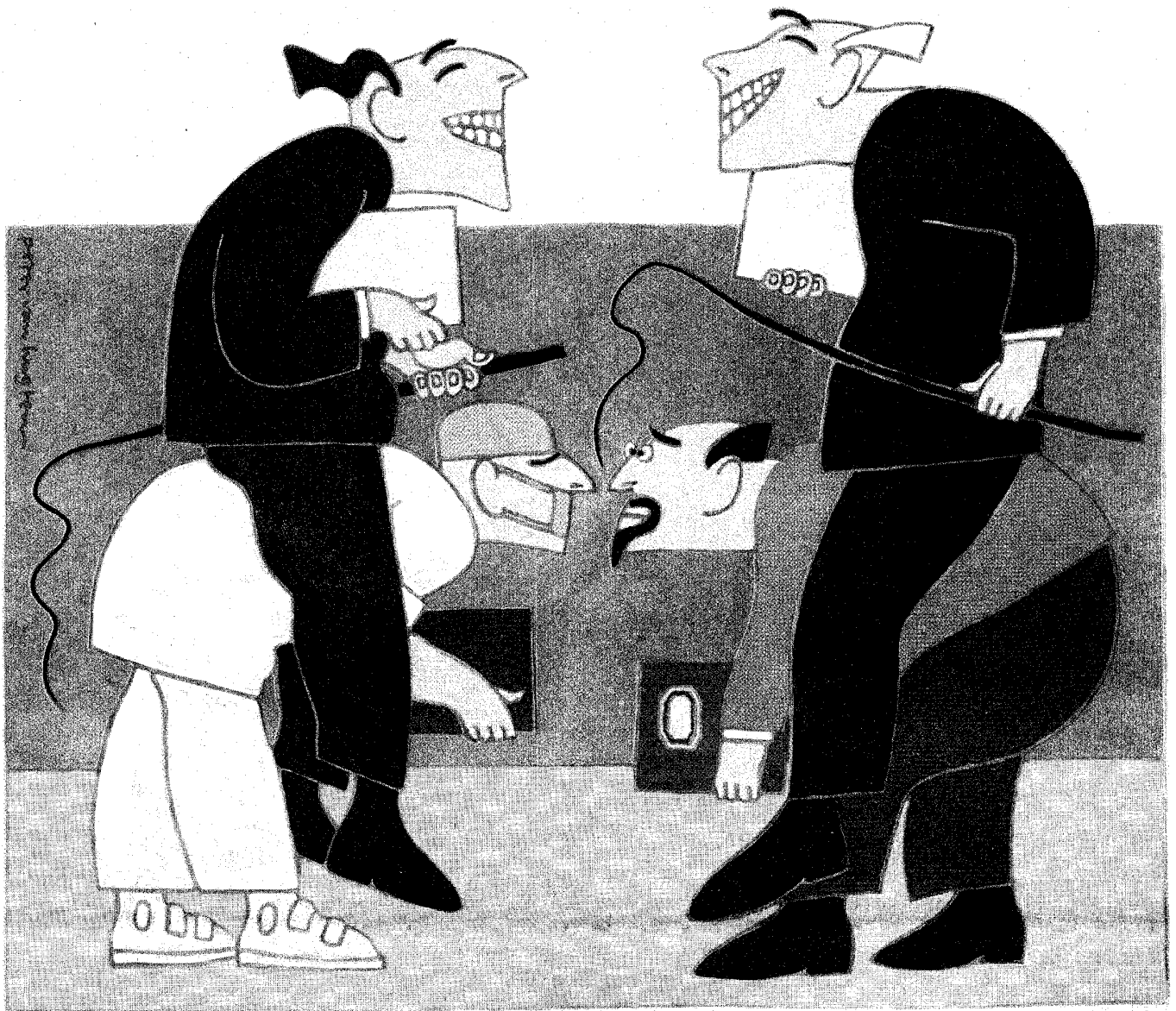
ILLUSTRATIE PETER VAN HUGHTEL